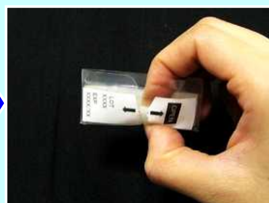
8. 指で隙間の中に挿し入れてください