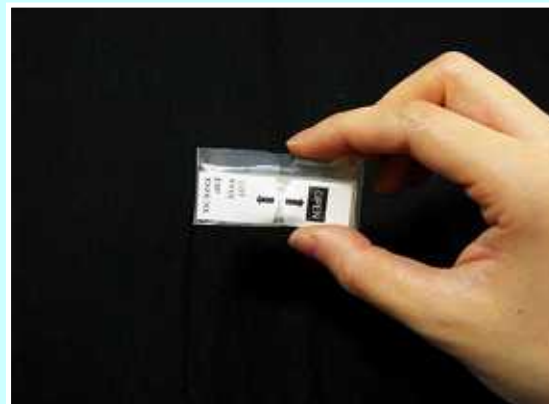
7. 片手でGT剤を持ってください