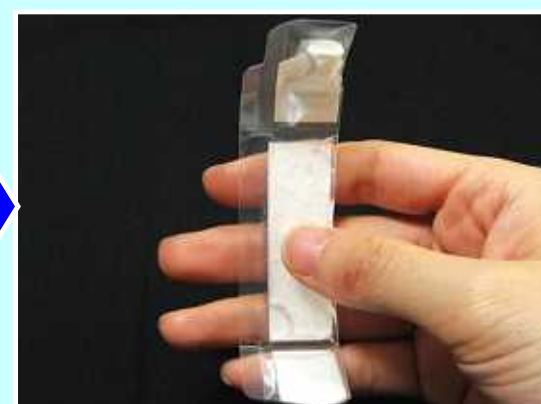
9. GT剤を縦にして、口に加えてください