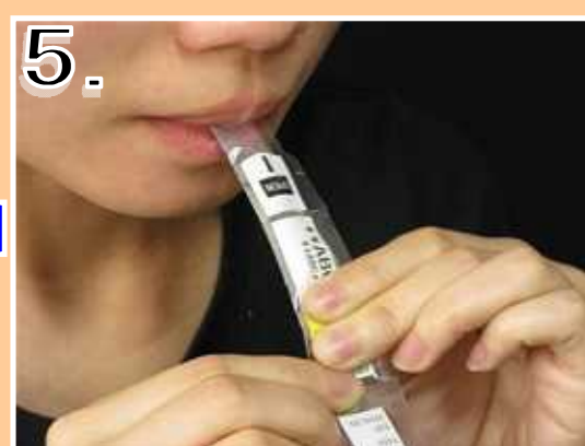
5. ゼリーの下部を押して、内容物を飲み込まないで、口に含んで下さい