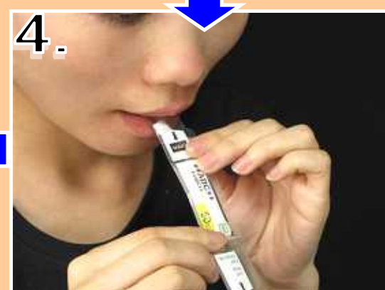
4. GT剤を縦にして、唇を半開きで、口に含んで下さい