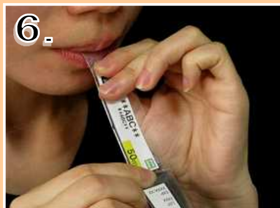
6. 薬剤とゼリーを同時に「ゴクン」と飲み込んで下さい 片手でも開ける